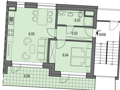
Plánky (/byty/brno- Plán zástavby

Průběh výstavby Vizualizace (/byty/brno-