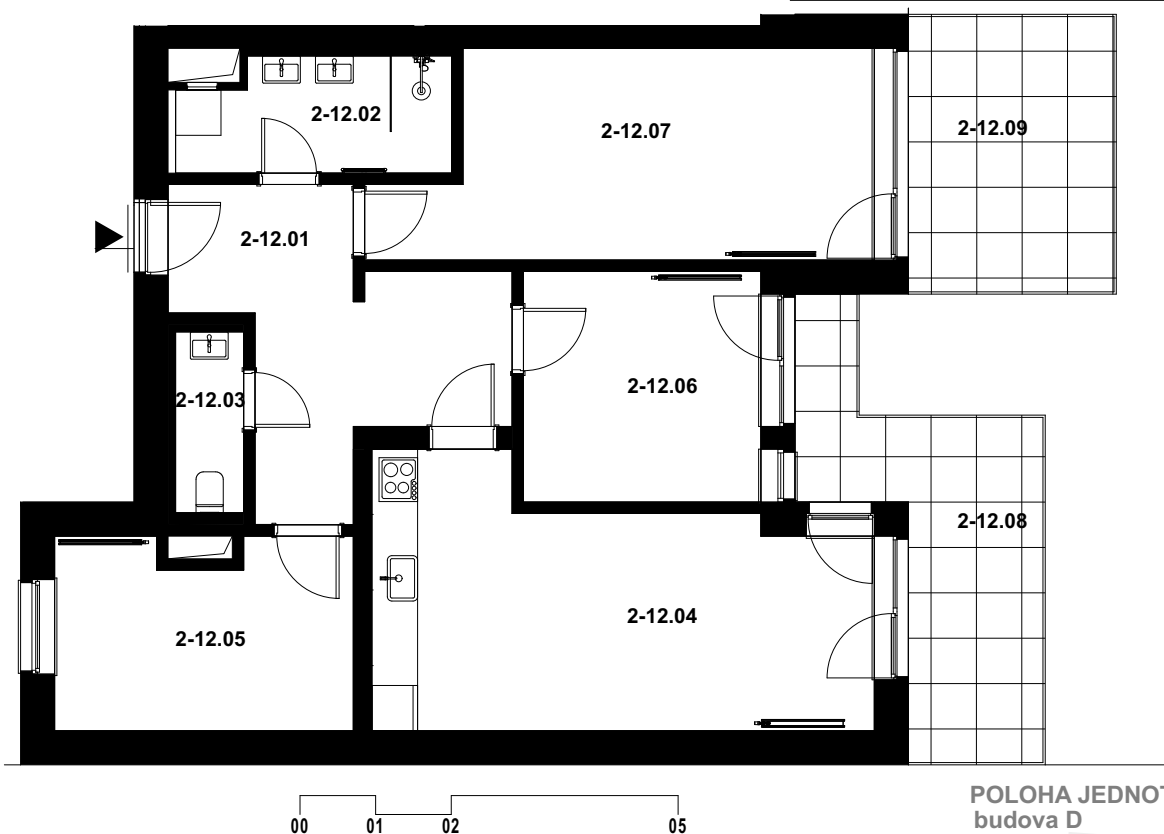
POLOHA JEDNOTKY V RÁMCI PODLAŽÍ budova D