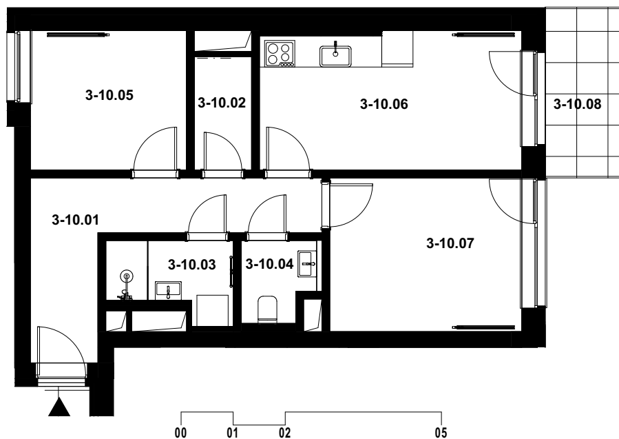
POLOHA JEDNOTKY V RÁMCI PODLAŽÍ budova D