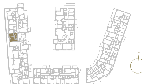
Schéma podlaží _____