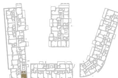
Schéma podlaží _____