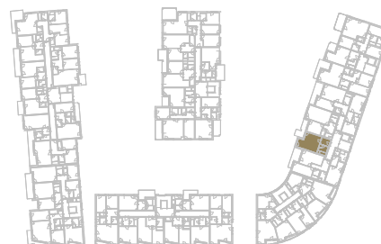
Schéma podlaží _____