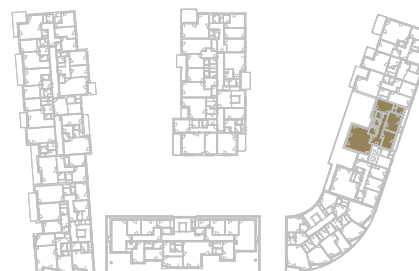
Schéma podlaží _____