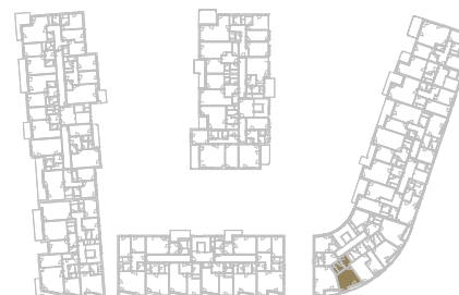
Schéma podlaží _____